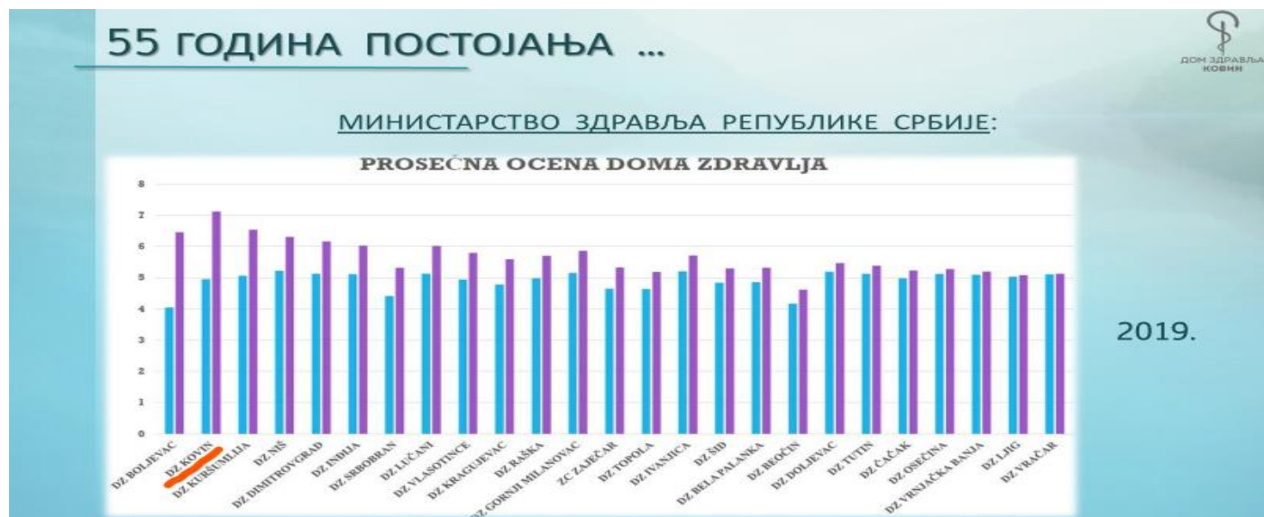
Табела број 16 : Просечне оцене најбољих домова здравља у Србији у 2019. години

У оквиру Другог пројекта развоја здравства Србије Министарство здравља Републике Србије је на основу праћења извршења Плана рада и учинка изабраних лекара у току 2019. израдило анализу реализације планова рада свих домова здравља који су у Плану мреже здравствених установа Републике Србије. Из графикон који следи, а који је под патронатом Министарства здравља РС јасно и недвосмислено показује позицију по питању просечне осеце најбољих домова здравља у Србији.